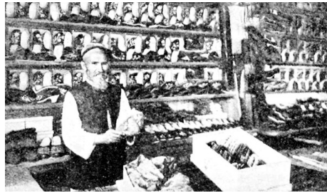
Кожевник из Старой Татарской слободы. http://www.iske-kazan.ru/29-razvitiie-remesel-i-torgovii .

Богатые татарские купцы иногда приглашают или, лучше сказать, бывают вынуждены приглашать к себе на чай губернатора и других главных чиновников. Это бывает в полдень. Сразу после чая угощают их