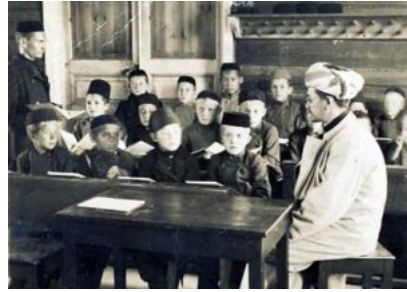
Восточное просвещение в школе при медресе. http://www.islamrf.ru/news/culture/history/22824/

Надо также отдать должное их муллам (священнослужителям). Они стараются распространять восточное просвещение не только по городам, но и в самых бедных деревушках, и в этом у них есть успехи. Почти каждый мулла имеет у себя до-