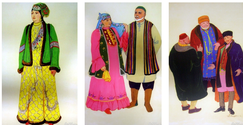
Л. Сперанская. Эскизы к альбому «Костюм казанских татар». 1970–1972.

http://art16.ru/content/spieranskaia_ll_vystavka_v_natsional_noi_khudozhiestviennoi_ghalierieie_khazine