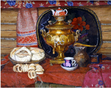
В. Стожаров. Чай с калачами. 1972. http://stilleben-art.ru/gal11/photo94.htm

Пища мещан и небогатых татар заключается в следующем. Утром они пьют чай с калачами; за обедом едят лапшу с