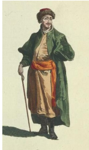
Гравюра. Казанский татарин. 1768.

Казанские татары имеют прекрасное телосложение. Лицо у них длинноватое, глаза больше серые или черные, взор их пронизателен; нос длинный с горбом, восточный; губы толстые, а верхняя довольно длинная; скулы слабо выделяются, борода черная, искусно подстриженная, около губ подбритая; череп продолговатый и тонкий, всегда голый от бритвы и покрытый тубетейкой; уши длинные и отстающие