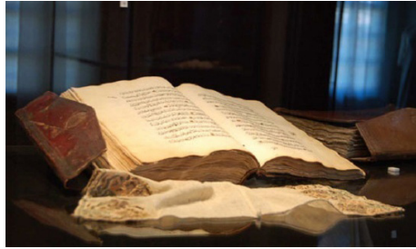
Первое мусульманское печатное издание Корана. http://islam-today.ru/istoriya/pervye_musulmanskie_pechatnye_izdaniya_korana_1_chast/