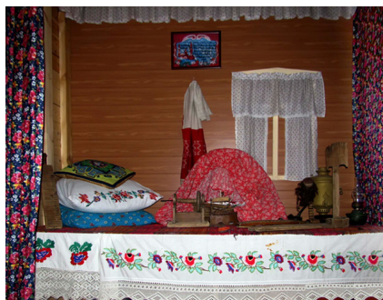
Фрагмент интерьера дома татар. Буинский район Республики Татарстан.

хижинах. Женщины свое хозяйство держат в большом порядке и чистоте. Они большие мастерицы печь хлеб. Нигде нет таких вкусных и густых сливок, как у татарок, особенно их каймак, вареные сливки, густые, как пенка. Я видел, как они опрятно доят коров: надевают большой фартук, моют теплую водой у коровы вымя и молоко покрывают чистым полотенцем. Многие татары в деревнях зимою коров не доят – они запасают осенью каймак и морозят в больших кадках вареное молоко и зимой, когда нужно, разогревают и едят. Обычное татарское кушанье в деревнях – салма, пельмени, горох, забеленный сметаной. Они выращивают капусту и охотно ее кушают, но ни один зажиточный татарин не отобедает без мяса.